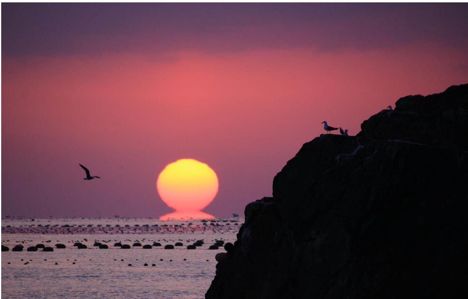
最優秀賞 桃色だるま（サンオーレ袖浜） 阿部文子氏（登米市）