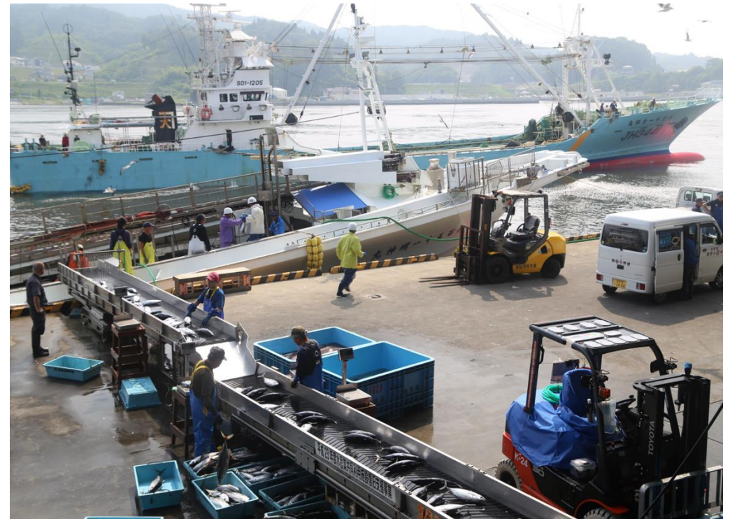
佳作 魚市場の朝（魚市場） 村上淳氏（気仙沼市）