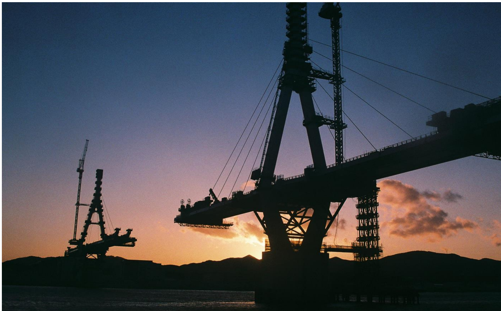
優秀賞 暮れる気仙沼港（気仙沼湾） 村上宏之氏（気仙沼市）