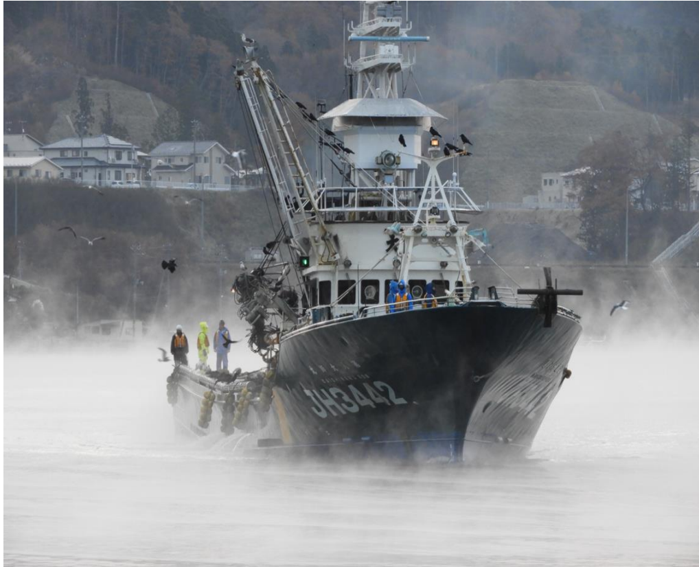
佳作 気嵐のなか入港（南町海岸） 大井憲一氏（気仙沼市）