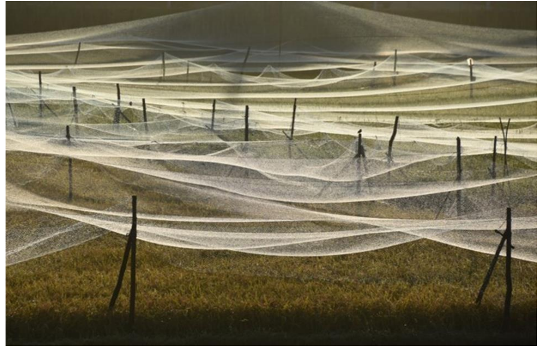
佳作 秋波（鳥さんに食べさせないよ！）（赤岩小田地内） 菊田清一氏（気仙沼市）