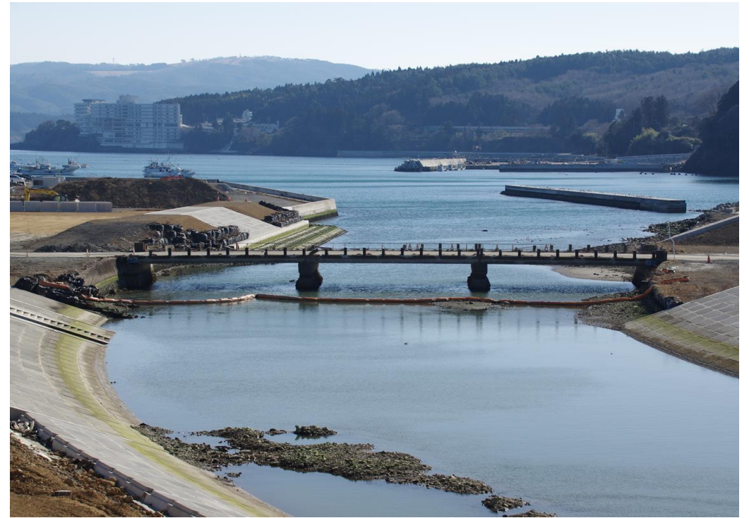
佳作 橋の思い出（八幡川河口） 高橋智一氏（栃木県鹿沼市）