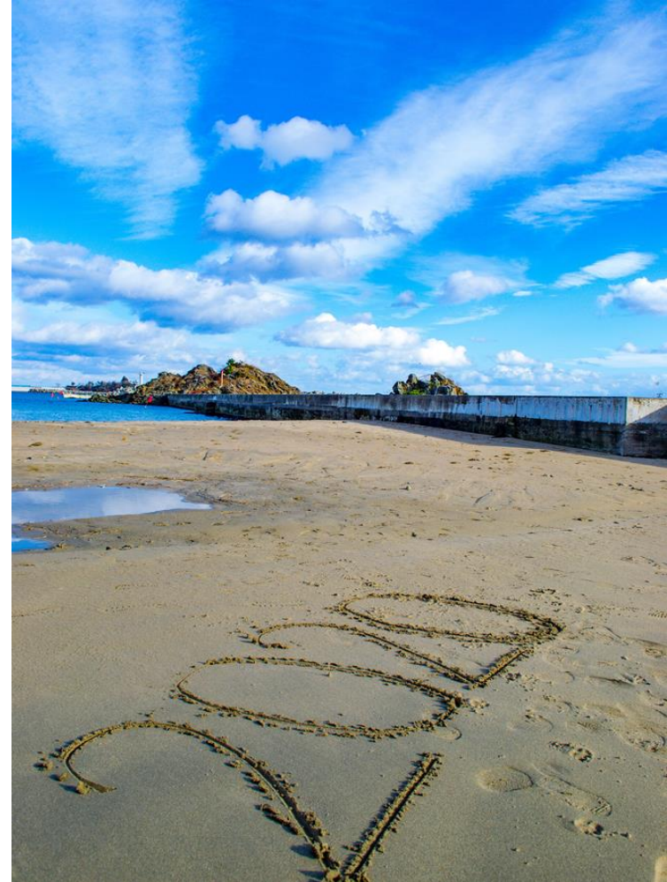
佳作 始まり（日門海岸） 内海凌成氏（気仙沼市）